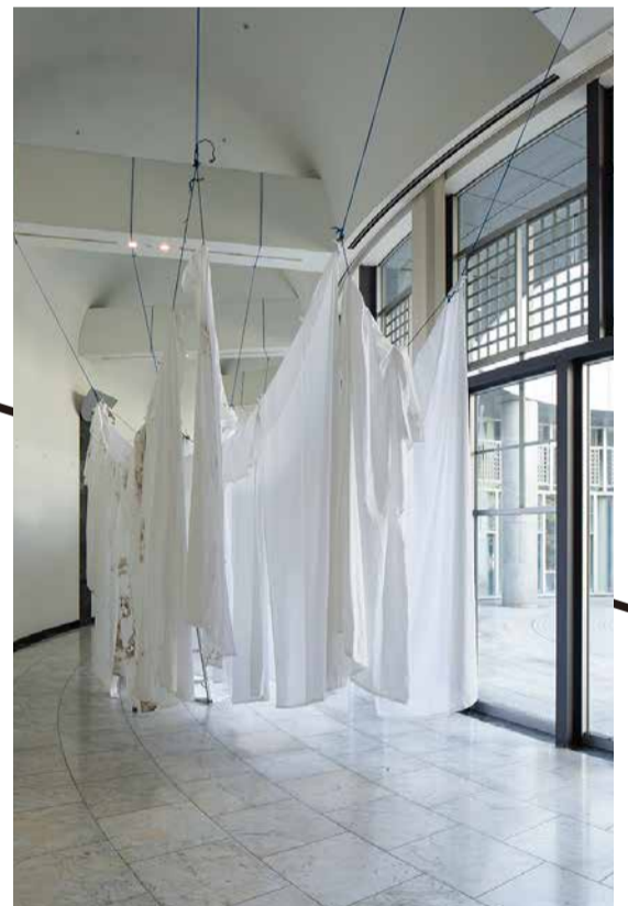
SHEETS, 2018