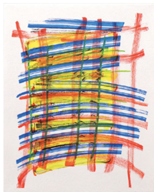
《ブルーボーダー、オレンジチェック》2020年、 化繊キャンバスに水性塗料他、26.6 x 21.3 x 2 cm Blue border, Orange check, 2020, Water based paint et al. on chemical fiber blend canvas