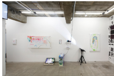
グループ展「貫く棒の如きもの」展示風景（TALION GALLERY）、 2019年 Group Exhibition, Piercing a rodlike thing , installation view (TALION GALLERY), 2019