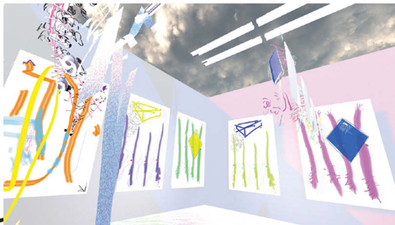
《In the Curtains》2019年、VR映像（部分） In the Curtains, 2019, VR (detail)