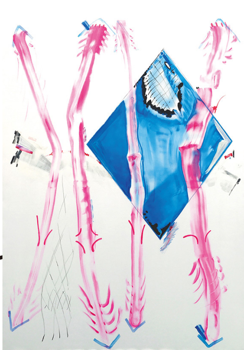
《Hot Pink Curtain》2019年、化繊混紡キャンバスに水性ペンキ他、180 x 130 cm Hot Pink Curtain, 2019, Water based paint et al. on chemical fiber blend canvas

「ザ・トライアングル」は当館のリニューアルオープンに際して新設された展示スペースです。京都ゆかりの作家を中心に新進作家を育み、当館を訪れる方々が気軽に現代美術に触れる場となることをねらいとしています。ここでは「作家・美術館・鑑賞者」を三角形で結び、つながりを深められるよう、スペース名「ザ・トライアングル」を冠した企画展シリーズを開催し、京都から新しい表現を発信していきます。