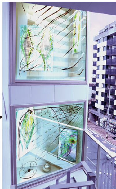
グループ展「楽観のテクニック」 展示風景（BnA Alter Museum SCG）、2020年 Group Exhibition, The Technique of Optimism , installation view (BnA Alter Museum SCG), 2020