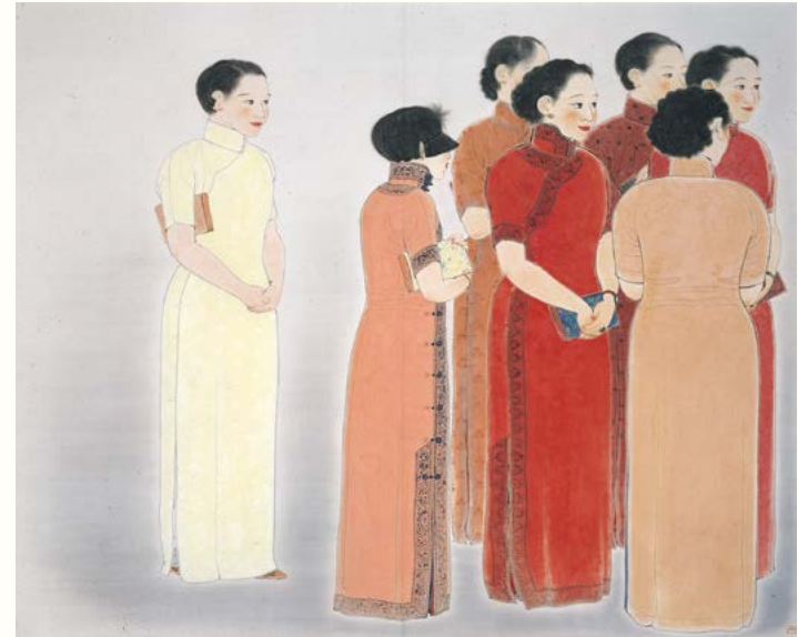
© Y. MAEDA & JASPAR, Tokyo, 2021 E4056