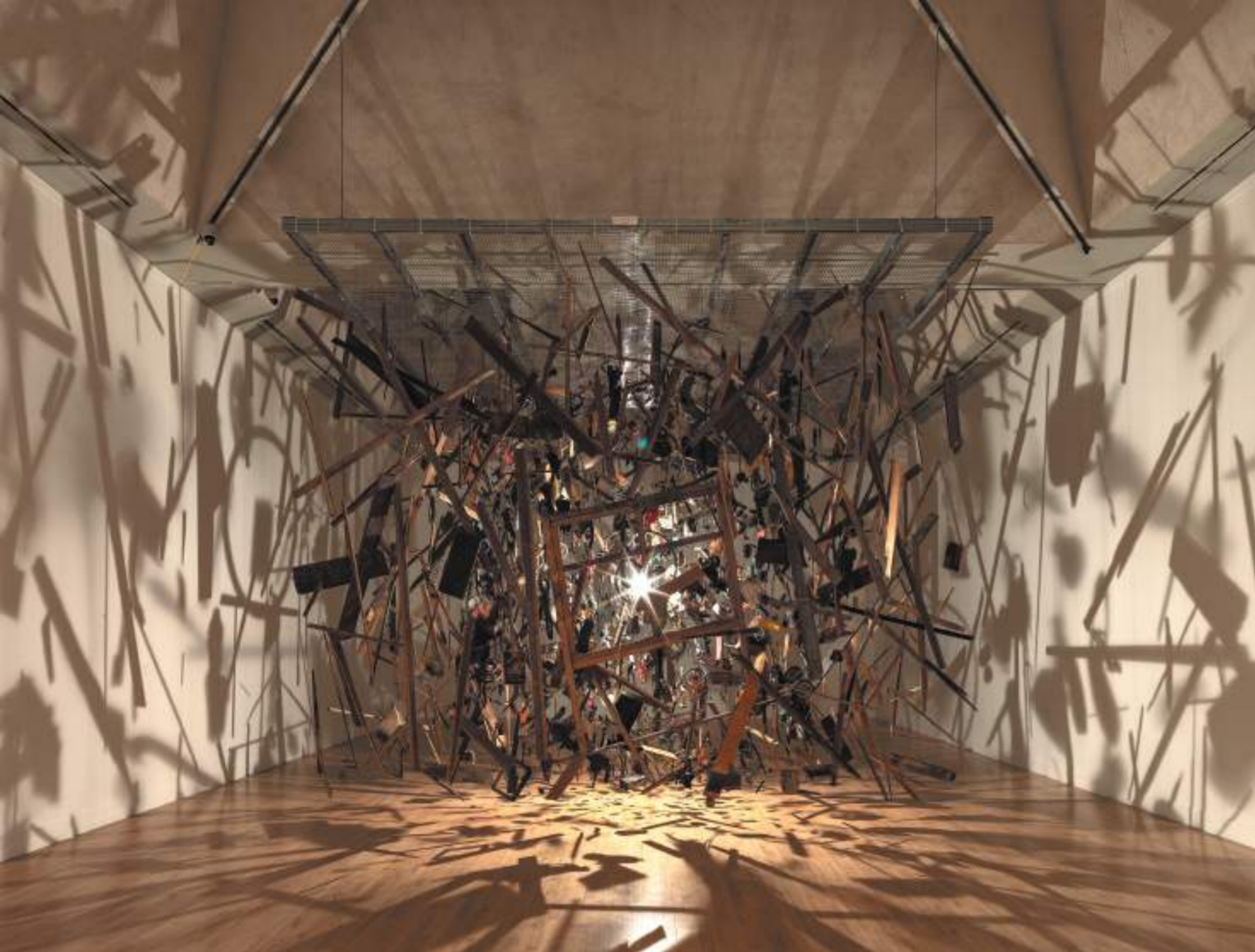
コーネリア・パーカー 《コールド・ダーク・マター：爆発の分解イメージ》 1991年