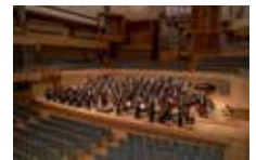
京都市交響楽団

京都市交響楽団：1956年に創立し、日本で唯一、自治体が設置し、運営に責任を持つオーケストラ。2015年「第46回サントリー音楽賞」受賞。2020年4月、第13代常任指揮者兼芸術顧問に広上淳一、首席客演指揮者にジョン・アクセルロッドが就任。文化芸術都市・京都にふさわしい「世界に誇れるオーケストラ」として前進を図っている。